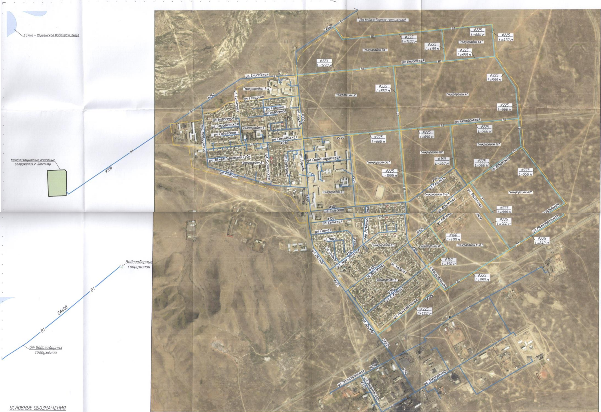
Схема перспективных сетей водоснабжения г. Шагонар